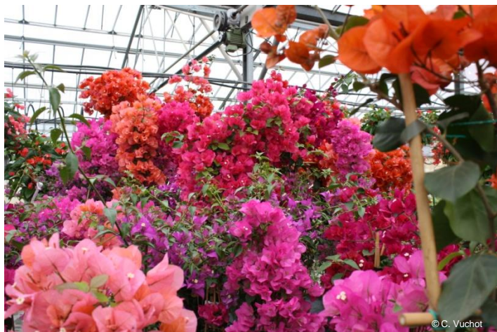
Bougainvillea, de différentes couleurs de bractées.